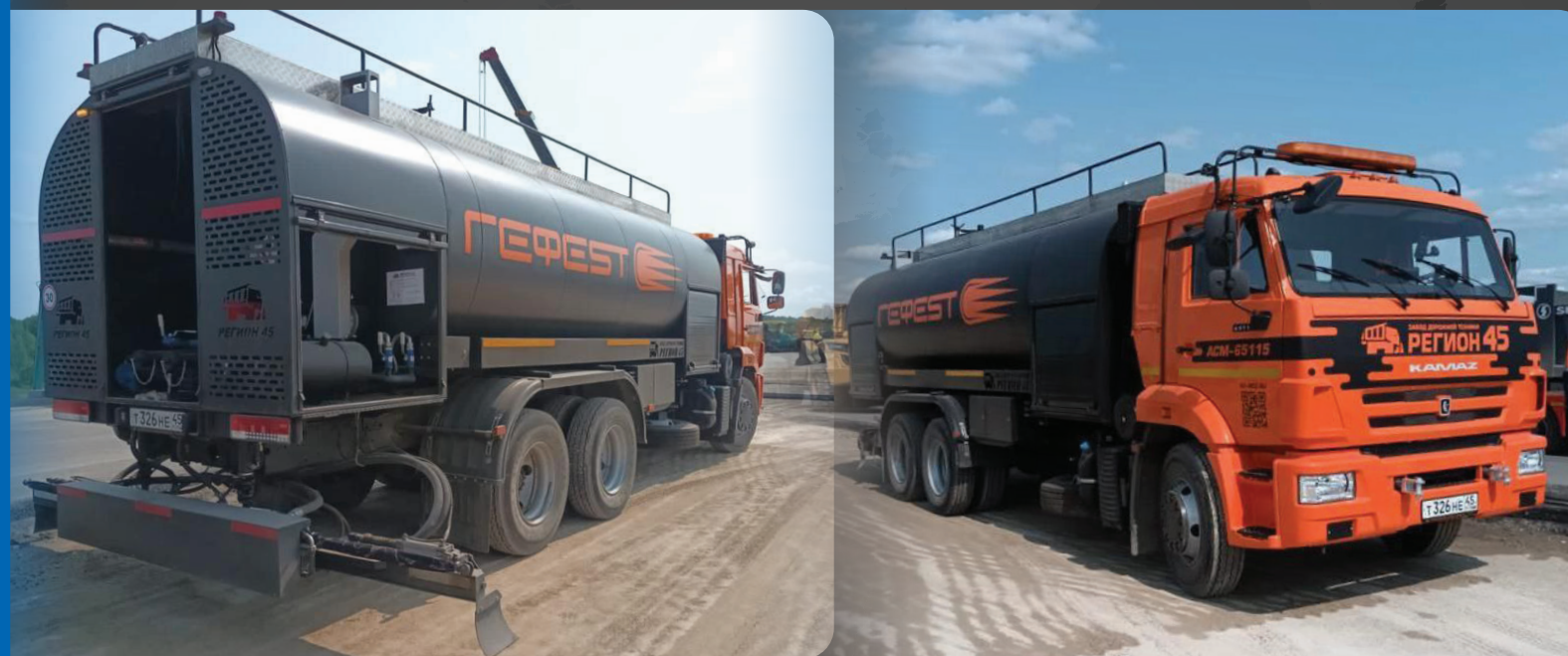
МАСЛЯНЫЙ АВТОГУДРОНАТОР АС-65115 «ГЕФЕСТ» НА БАЗЕ ШАССИ АВТОМОБИЛЯ КАМАЗ-65115